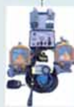
Central de superfície

LM Bags importados dos EUA totalmente fechados, fabricados pela SUBSALVE, empresa que atua há mais de 20 anos na área de SALVAGEM