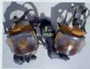
INTERSPRO Diver MK II