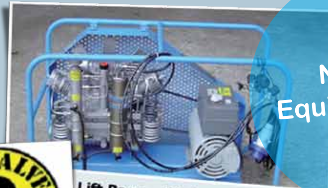
Lift Bags – Várias configurações